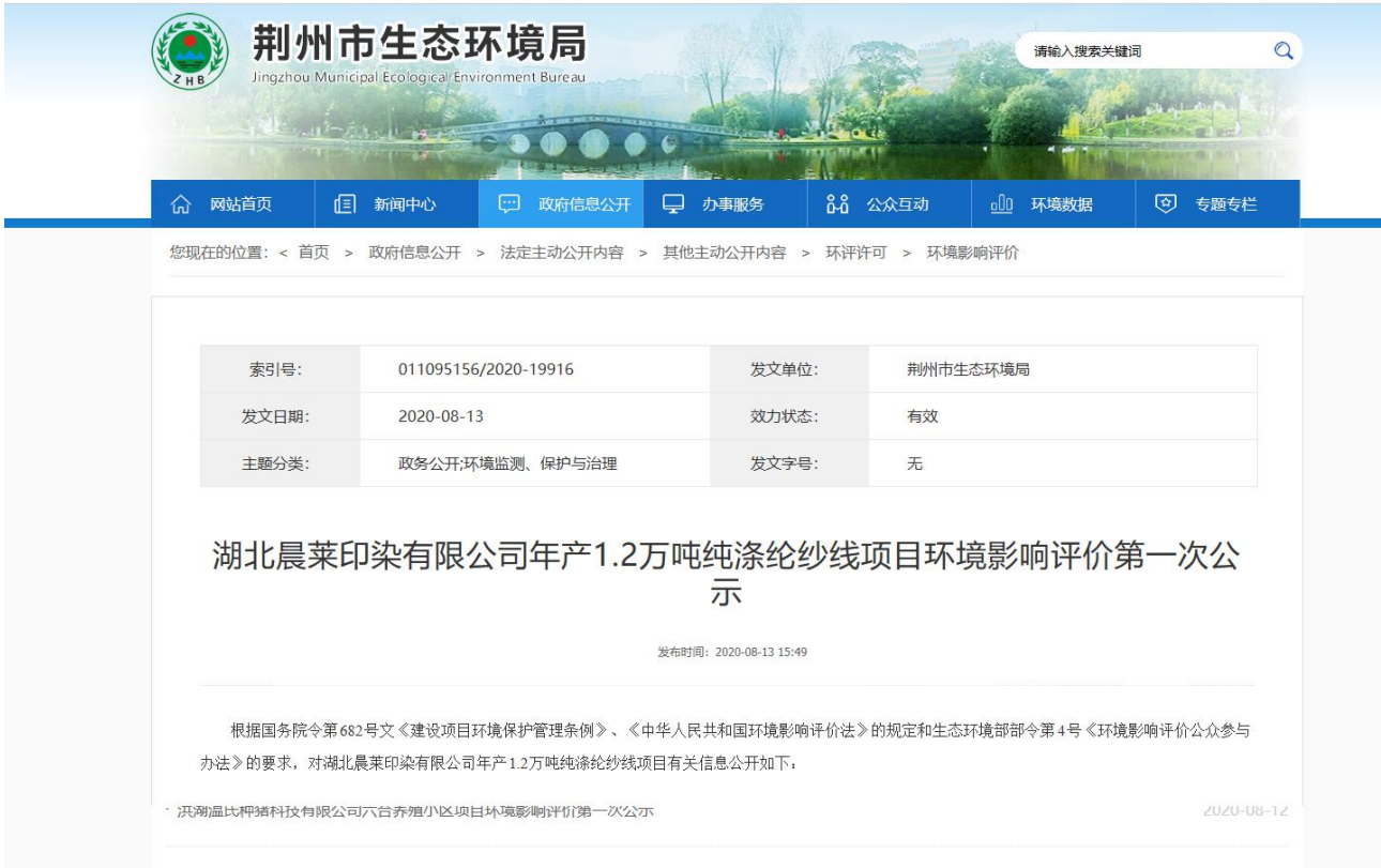
图 1 首次环境影响评价信息公开公示