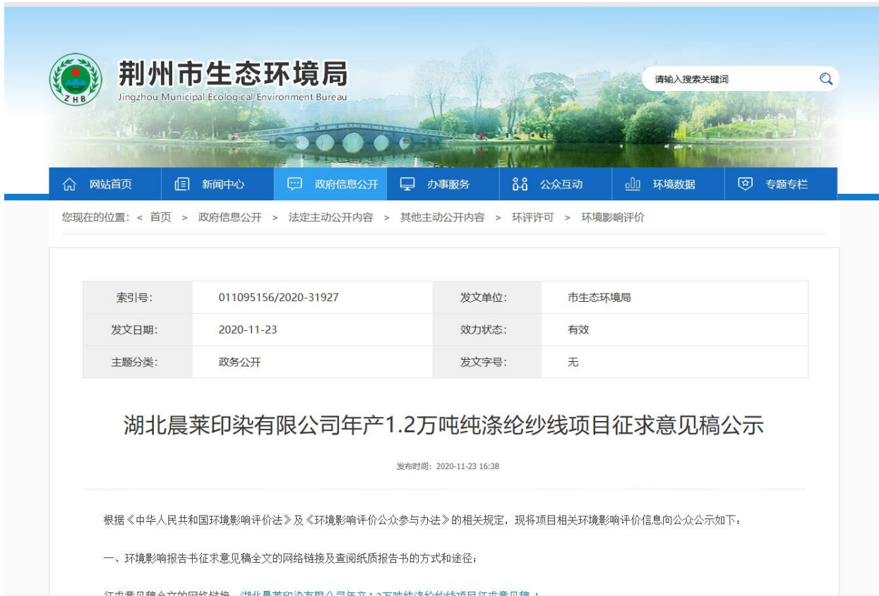
图3.2-1 征求意见稿网络公示内容截图